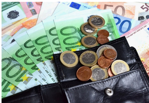
Die grün-rote Ratsmehrheit sattelt drauf.

Mangelnde Haushaltsdisziplin und fehlende finanzpolitische Verantwortung kennzeichnen den grün-roten Haushaltsbeschluss für 2023. Zu dieser Auffassung gelangte die CDU-Fraktion als Reaktion auf die Pläne der Mehrheitsgruppe. Denn Grüne und SPD satteln über den Verwaltungsentwurf hinaus, der bereits ein Defizit von 6,7 Millionen Euro aufweist, weitere drei Millionen drauf.