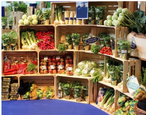
Gesunde Ernährung ist auch mit regionalen Produkten möglich.

Regional und saisonal vor Bio: Nach diesem Grundsatz möchte die CDU-Ratsfraktion Oldenburg bei der Essensverpflegung in den Schulmensen verfahren. In einem Änderungsantrag für die November-Sitzung des Rates setzte sich die Fraktion dafür ein, das Rahmenkonzept der Stadt dahingehend zu überarbeiten. Die Verwaltungsvorlage, die eine Komplett-Umstellung weiterer Warengruppen auf Bio-Produkte für die nächsten Jahre vorsieht, hält die CDU hingegen nicht für zielführend.